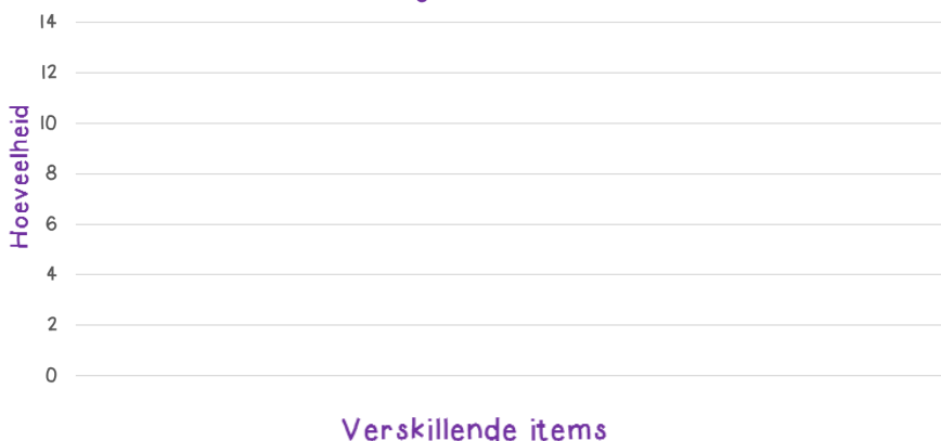
'n Dag op die strand

7. Gebruik die data en maak jou eie staafgrafiek: